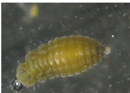
Larva de Coccidophilus citrícola