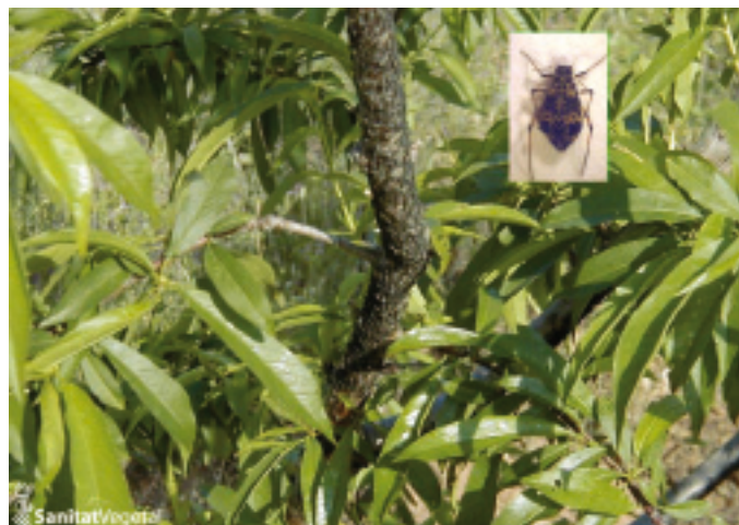
Pulgón de las ramas (Pterochloroides persicae)

En el caso de detectar el ataque de esta plaga realizar el tratamiento de invierno adecuado para su control.