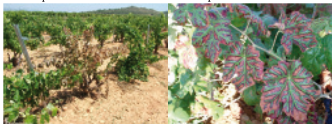
Yesca: forma lenta

Información general: Las enfermedades fúngicas de la madera están causadas por un complejo de hongos patógenos, cuya característica común es que producen una alteración interna de la madera, en forma de pudrición seca o necrosis, provocando una reducción del desarrollo vegetativo y un decaimiento general, que incluso puede acabar con la muerte de la planta.