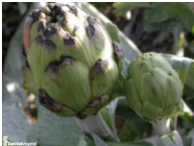
Detalle del capítulo afectado por A. hortorum

Tras la primera infección del hongo puede sobrevenir una secundaria de botritis, lo cual debe ser tenido en cuenta para eliminar cuanto antes el material vegetal afectado y disminuir la presión del inóculo ya que no hay registrado ningún producto antibotritis autorizado para alcachofa.