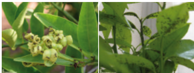
Colònia d' Aphis spiraecola

Els pugons viuen en els brots tendres en desenvolupament i la seua abundància està lligada a la brotada que s'esdevé al llarg de l'any, sent-ne més important la de primavera. A més, els danys estan relacionats amb la intensitat de la brotada i són més grans com més gran és aquesta. Per això, cal vigilar la seua presència i parar especial atenció a les noves brotades de plançons, empeltades, arbres en formació i algunes varietats de clementiners, que presenten brots tendres durant més temps.