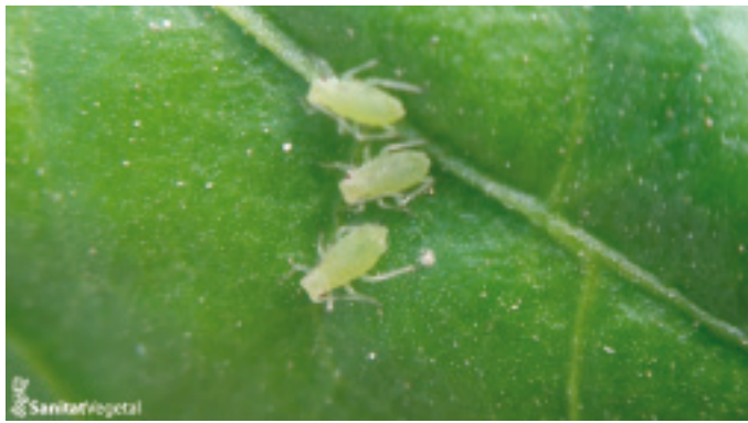
Colònia de pugó en fulla