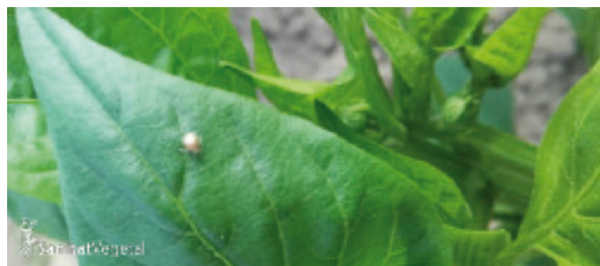
Detall de mòmia de pugó parasitat.

que segreguen la melassa típica en aquests insectes i provoquen posteriorment l'aparició del fredolíc (fumagina).