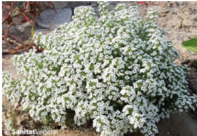
Detall de Lobularia maritima

Es recomana col·locar plantes que servisquen de reservori al N. tenuis . La més efectiva és l'olivarda ( Dittrichia viscosa ), la resina de la qual atrau de manera molt efectiva els mírids en general. Es poden col·locar en el perímetre de la parcel·la i el seu port l'lenyós la fa molt resistent a la sequera, per la qual cosa no necessita cap cura especial. També es recomana col·locar l'espècie Lobularia maritima , ja que disposa de flors amb pol·len durant tot l'any. D'aquesta manera, aquells paràsits de la Tuta com ara el Necremnus tutae disposaran d'aliment i afavoriran la seua instal·lació en el cultiu.