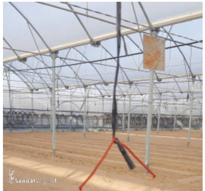
Detall de difusor de feromona

La tècnica de la confusió sexual ha d'usar-se en combinació amb altres eines disponibles de bioprotecció, com ara els productes a base de microorganismes ( Bacillus thuringiensis ), virus o extractes naturals i soltes d'insectes útils (mírids o parasitoides), per a fomentar un major equilibri en el cultiu i afavorir també la presència d'enemics naturals, com ara el paràsit Necremnus tutae .