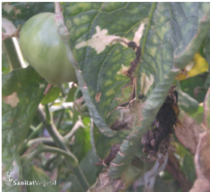
Danys de Tuta absoluta en fulla de tomaca

Amb això, els mascles confosos romanen inactius i detenen el seu vol a causa de l'habitució a la feromona (Baker i col. 1989); en altres casos en què el mascle és capaç d'orientar-se en contra el vent, és probable que la concentració cada vegada més alta de feromona provoqe fatiga sensorial i/o que l'arna es desvia abans de trobar la font emissora.