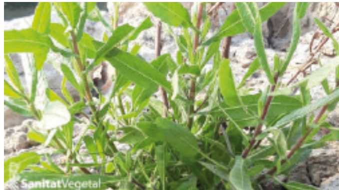
Detall de la planta d'olivarda

disposar de bons tancaments amb malles de 6x9 en les finestres, així com una doble porta d'entrada a l'hivernacle. Tot el que siga retardar l'entrada dels adults a l'hivernacle serà d'utilitat per a mantindre la pressió de la plaga sota control i només es requerirà el tractament fitosanitari en última instància.