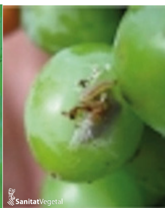
Daños de 2ª generación.