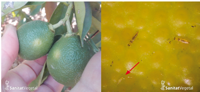
Zona de contacto entre frutos donde se localizan los trips. Adultos y larva del trips de la orquídea.

El tratamiento se deberá realizar cuando se alcance el 10 % de frutos en contacto con presencia de trips.