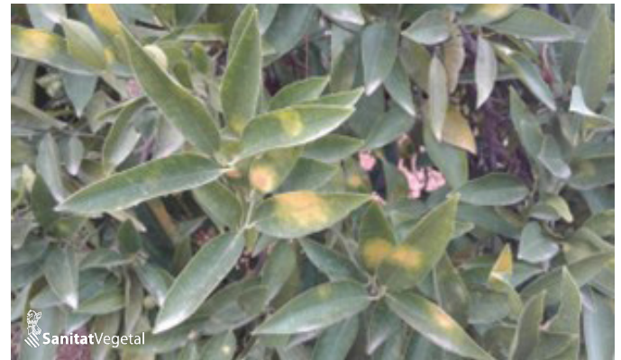
Hojas sintomáticas por ataque de la araña roja

En estos momentos y en algunas parcelas se empieza a ver nuevas colonias en las hojas jóvenes.