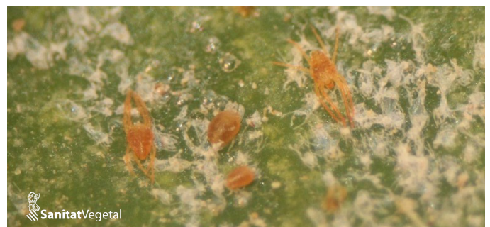
Colonia del ácaro rojo oriental en hoja

Se recomienda muestrear hojas totalmente desarrolladas de las últimas brotaciones, tomando 4 hojas por árbol de 25 árboles al azar por toda la parcela y contabilizando el porcentaje hojas ocupadas por ácaros.