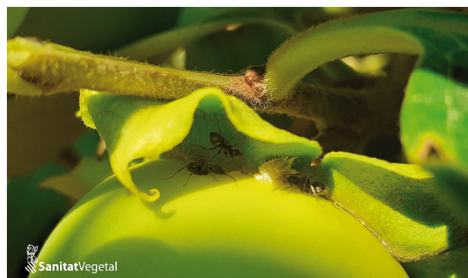
Hormigas y cotonet

Productos autorizados: aceite de parafina, aceite de naranja, sales potásicas de ácidos grasos, spirotetramat, sulfoxaflor (autorización excepcional).