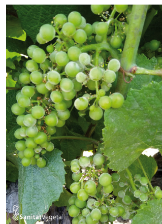
Primeros síntomas de oidio en racimo

Por todo ello, les recomendamos mantener la protección del viñedo frente a esta enfermedad.