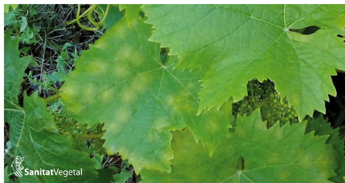
Manchas de aceite en hojas

En este momento fenológico, se recomienda la utilización de fungicidas "Penetrantes", o de "Fijación a las Ceras Cuticulares".