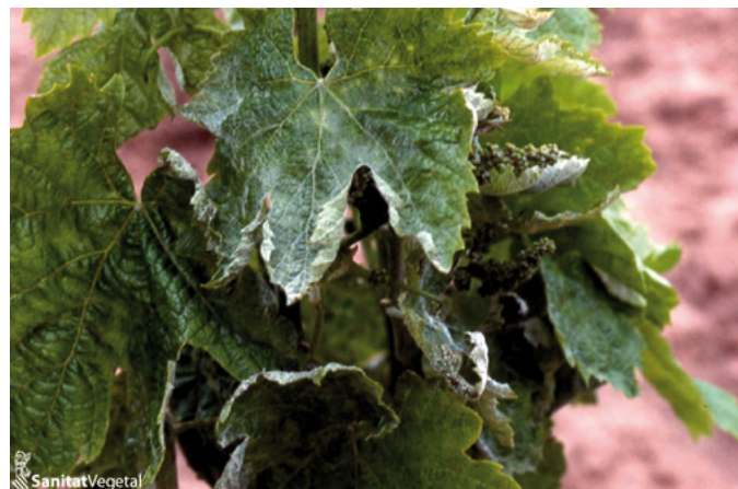
Oídio en hojas