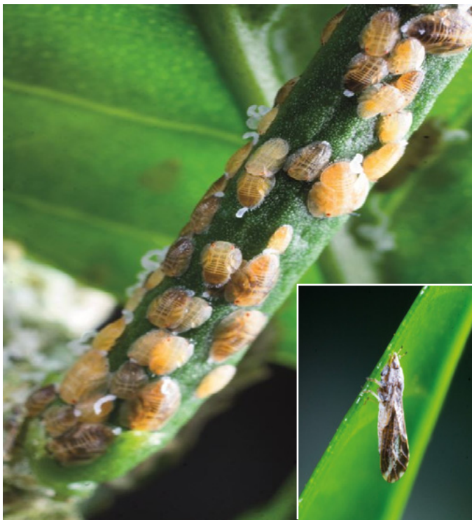
Ninfas con secreciones cerasas y adulto de Diaphorina citri