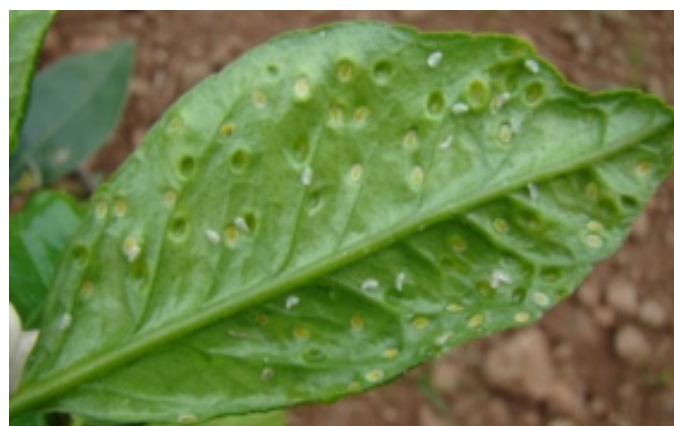
Abollonaduras generadas por las ninfas en el envés de hojas