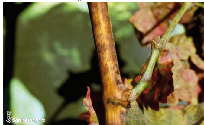
Oídio en sarmiento

la vegetación. Cuando el sarmiento está completamente lignificado el color es totalmente negruzco.