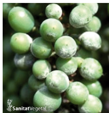
Oídio en racimos

El principal daño de oídio se produce en los racimos. Si el ataque se produce en floración-cuajado, los granitos aparecen con un tinte plumizo y se recubren del polvillo blanco ceniciento. Los daños más importantes se localizan en los granos desarrollados, ya que se produce la detención del crecimiento de la piel y al crecer las bayas es frecuente que se produzca el rajado de éstas, produciéndose