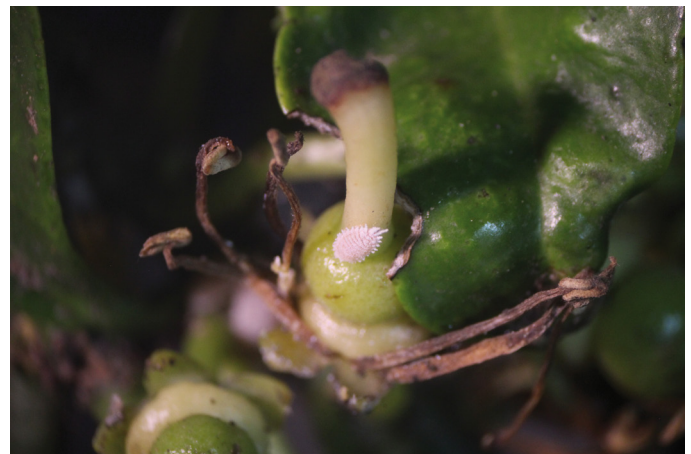
Hembra cotonet de Sudáfrica sobre fruto recién formado

el ombligo de las naranjas del grupo navel o entre frutos en contacto. A partir de la cosecha, se localizan generalmente en las ramillas y hojas, principalmente en hojas previamente dañadas por araña roja, minador o pulgones que provocan recovecos donde se fijan y refugian. Desde el final del invierno, es fácil observar su desplazamiento por el tronco y ramas principales y, también en el suelo. Esta característica facilita la identificación de los árboles infestados con cotonet en aquellas parcelas afectadas recientemente y, por lo tanto, sirve para localizar los primeros focos.