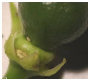
Ninfa de cotonet de Sudáfrica sobre fruto recién formado

cada uno de los lados de la parcela. Con una periodicidad semanal. El seguimiento se realizará desde la floración hasta que el fruto alcance 3-4 cm.