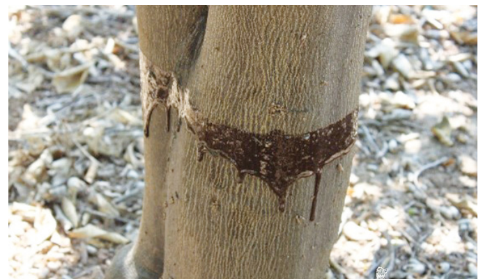
Pasta colocada en el tronco para impedir el movimiento ascendente de las hormigas

Las hormigas establecen relaciones mutualistas con los cotonets, ayudan a su propagación y evitan los agentes de control. Para evitar la presencia de hormigas en la copa, se recomienda colocar barreras físicas, a base de pastas o colas, alrededor del tronco en su parte baja a la salida del invierno. Esta acción debe estar acompañada de una poda que evite que las ramas toquen al suelo, para evitar que las hormigas suban por ellas. La duración de las pastas o colas es variable, por lo que se deberá renovar cuando se observe que las hormigas la traspasen.