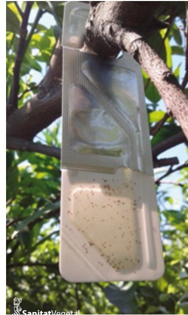
Trampa de atracción y muerte con feromona para el cotonet de Sudáfrica

Se recomienda colocar trampas de atracción y muerte cebadas con feromona que incorporan un insecticida. Se pueden colocar desde el 15 de febrero, a una dosis de 450 trampas/Ha y se seguirá la población mediante monitoreo. El emisor contiene feromona de tres especies de insectos, el cotonet de Sudáfrica, el cotonet de los cítricos y el piojo rojo de California.