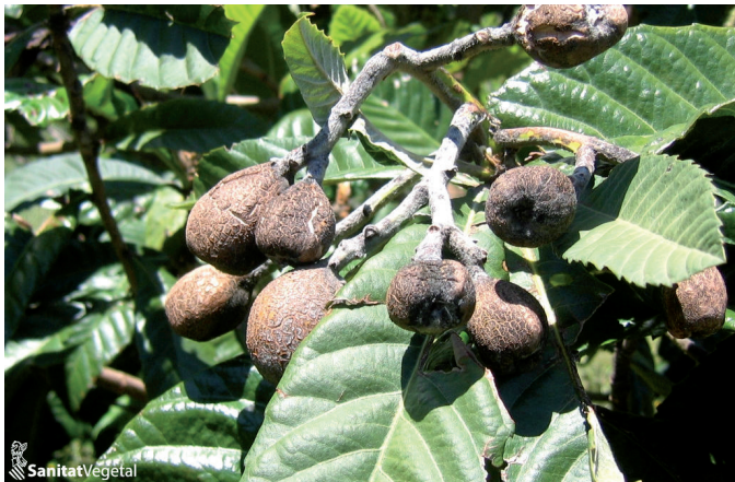
Frutos momificados por moteado

Según las condiciones climáticas del otoño, lluvias frecuentes y persistencia de la humedad en hoja, son necesarias para el desarrollo del hongo por lo que se recomienda, cuando se den estas condiciones, extremar las precauciones.