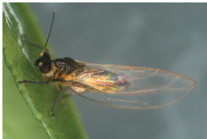
Adulto de Trioza erytreae alimentándose.