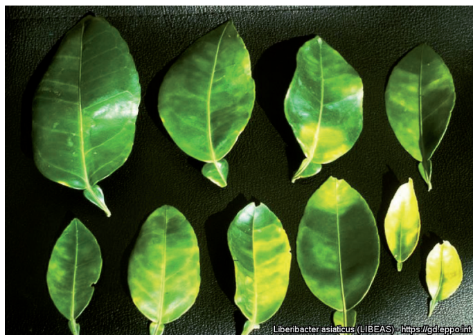
Liberibacter asiaticus (LIBEAS) - https://gd.eppo.int