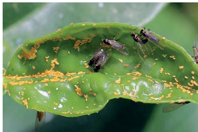
Huevos de Trioza erytreae : anaranjados, cilíndricos, punta afilada.

Trioza erytreae es el vector que puede transmitir el HLB. Actualmente está presente y dispersándose en zonas de España (cornisa cantábrica) y todo Portugal.