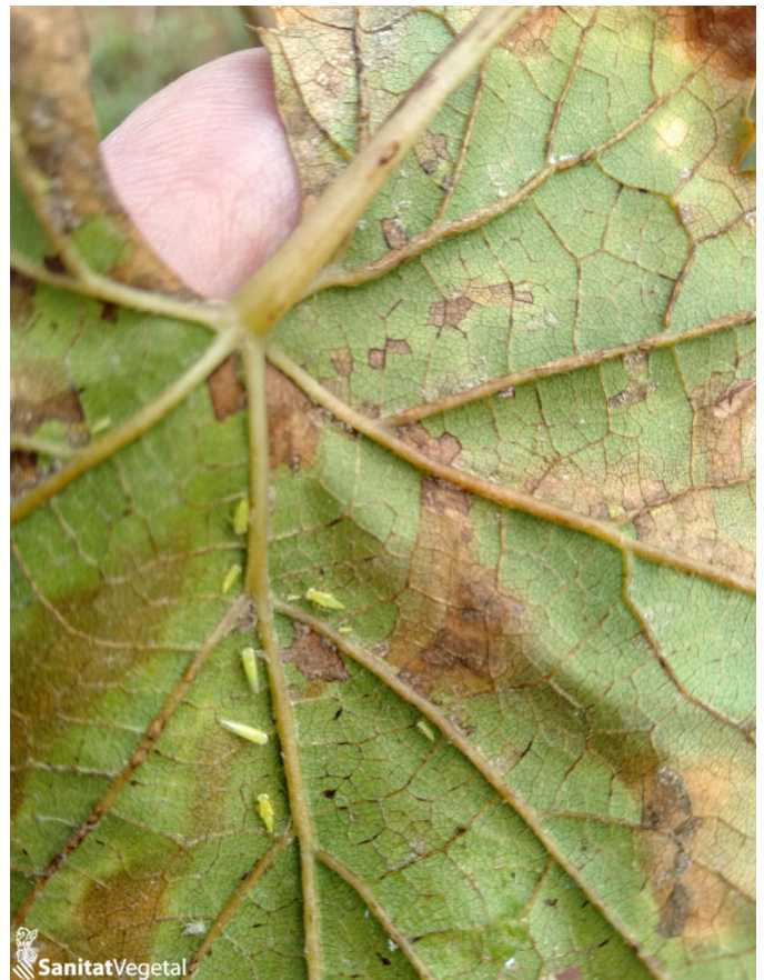
Adultos y ninfas de mosquito verde

A finales de esta campaña se han observado poblaciones elevadas de esta plaga, de forma generalizada en todas las zonas vitícolas de la Comunitat, pero especialmente en los viñedos de Uva de mesa del Vinalopó.