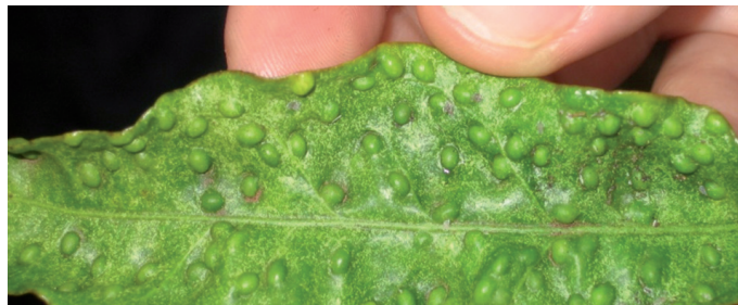
Abollonaduras en el haz.

Síntomas de Trioza erytreae EN HOJAS: Las ninfas provocan abollonaduras en el haz y cavidades en el envés