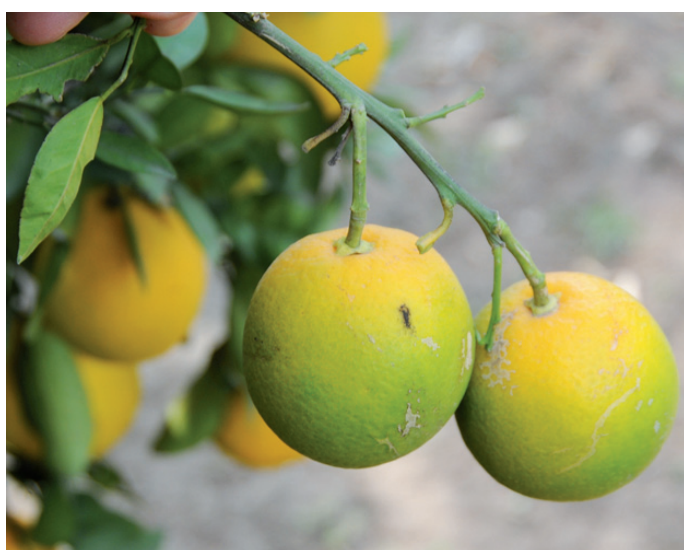
Decoloración inversa.