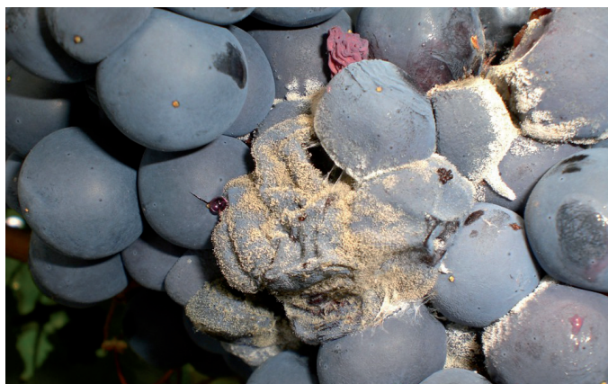
Foco de botritis producido por Lobesia botrana