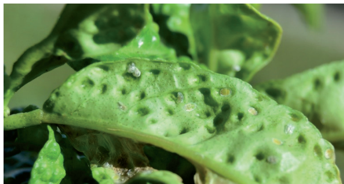
Cavidades en el envés.