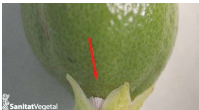
Femella de cotonet de Sudàfrica sota el calze d'un fruit recentment format.

Altres observacions que poden ajudar a prendre decisions són: l'evolució de l'estructura poblacional (cal recordar que els primers estadis ninfals són més sensibles als insecticides), i la mitjana de graus dia acumulats des de l'1 de gener.