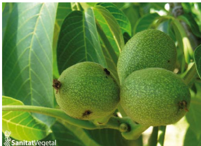
Danys Carpocapsa en anouer

http://www.mapama.gob.es/ministerio/pags/Biblioteca/Revistas/pdf_DT%2FDT_2009_38_8_17.pdf