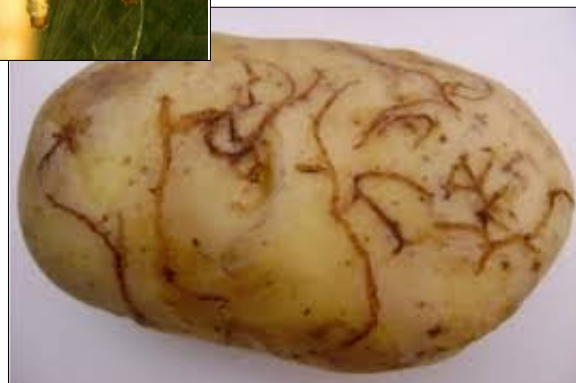
Daños producidos por adultos