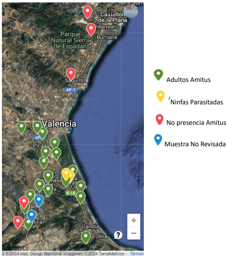
Mapa Municipios Prospectados Amitus Spiniferus en la Comunidad Valenciana 2020-2023