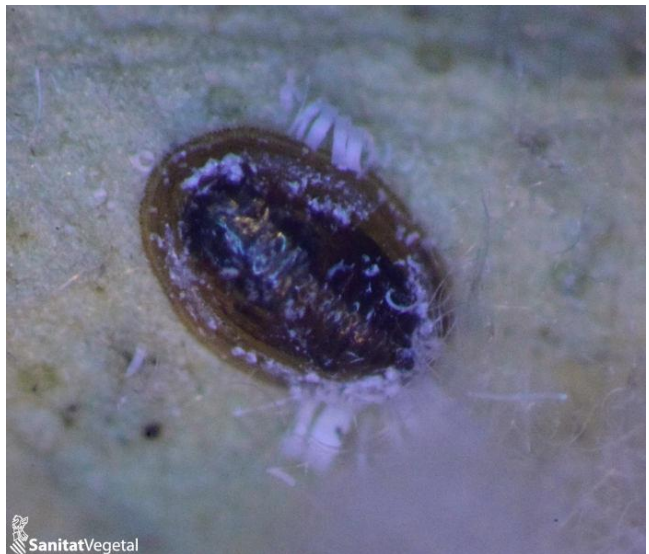
Moscas blancas parasitadas por A. spiniferus

Biología: es un endoparasitoide solitario y koinobionte, no paraliza al huésped. De hecho, parasita ninfas de 1º y 2º estadio y el adulto emerge del último estadio ninfal de la mosca blanca. Su huésped principal es la mosca blanca algodonosa, Aleurothrixus floccosus , pero puede parasitar otras moscas blancas. Su acción es complementaria a la del Cales noacki en el control de la mosca blanca algodonosa.