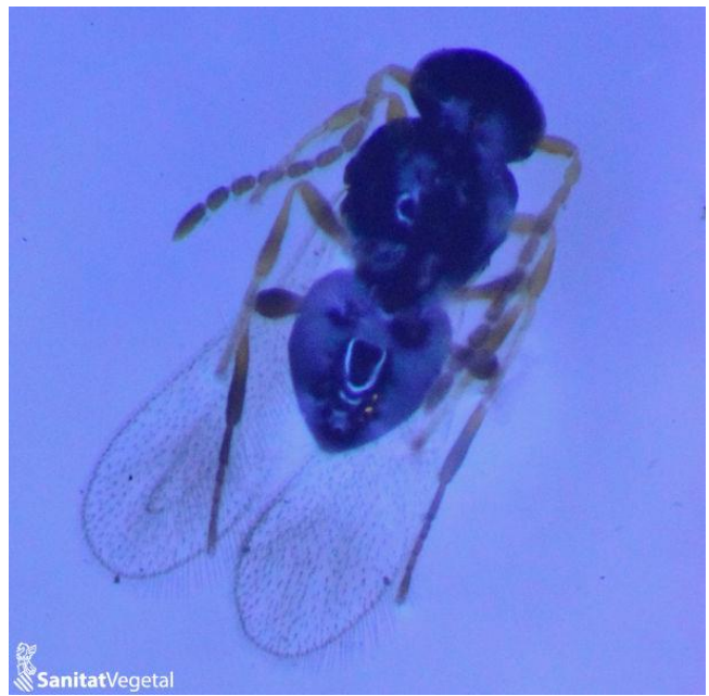
Adultos de A. spiniferus

Biología: es un endoparasitoide solitario y koinobionte, no paraliza al huésped. De hecho, parasita ninfas de 1º y 2º estadio y el adulto emerge del último estadio ninfal de la mosca blanca. Su huésped principal es la mosca blanca algodonosa, Aleurothrixus floccosus , pero puede parasitar otras moscas blancas. Su acción es complementaria a la del Cales noacki en el control de la mosca blanca algodonosa.