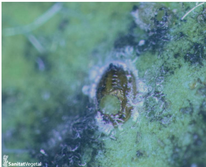
Ninfas de mosca blanca con orificio de salida y adulto de A. spiniferus emergiendo