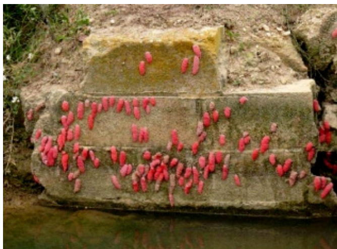
Puesta en estructura de hormigón en el margen del río (GenCat)

Foto: Protocolo prospección Pomacea (MAGRAMA)