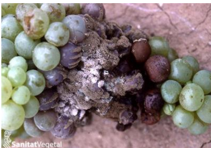
Danys de Botritis sobre raïm blanc

Esta aplicació es podrà realitzar en el primer o en el segon passe de cuc del raïm, però els recordem que l'últim tractament antibotritis s'ha de realitzar com a mínim, 21 dies abans de la verema, per a evitar problemes en la fermentació dels mostos.