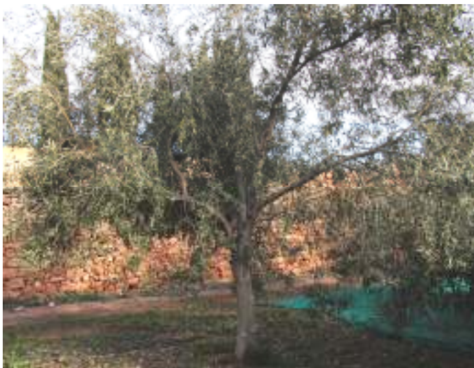
Foto 2. Árbol con algunas ramas insertadas en ángulo demasiado abierto que no transmiten bien la vibración.

Foto 1. Máquina vibradora trabajando. Obsérvese la inserción de ramas principales conveniente para una adecuada transmisión de la vibración.