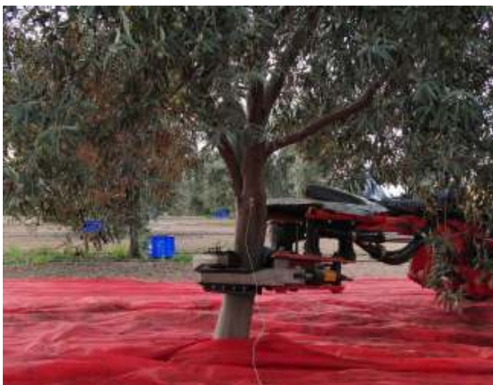
Foto 3. Detalle del pinzado; sensor para determinar la amplitud de vibrado.

Foto 2. Árbol con algunas ramas insertadas en ángulo demasiado abierto que no transmiten bien la vibración.