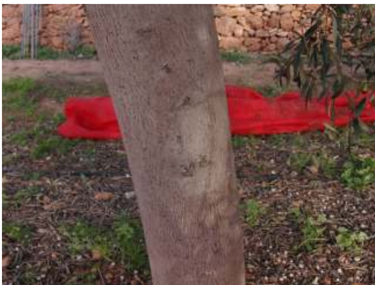
Foto 4. Tronco de olivo tras la realización de los ensayos, sin daños en la corteza del tronco. Se observa una zona de color más claro en el punto de agarre de la pinza.

No se dañó la corteza de ningún árbol, hasta el punto de resultar difícil, una vez realizado el ensayo, localizar la zona donde se aplicó la pinza. Esta era una preocupación grande de los investigadores, pues en las zonas olivareras de la Comunidad Valenciana se producen abundantes daños de descortezado. Probablemente las máquinas no se encuentren en las adecuadas condiciones de mantenimiento (poco engrase de los tacos, gomas nuevas, tiempo excesivo de vibrado, etc).