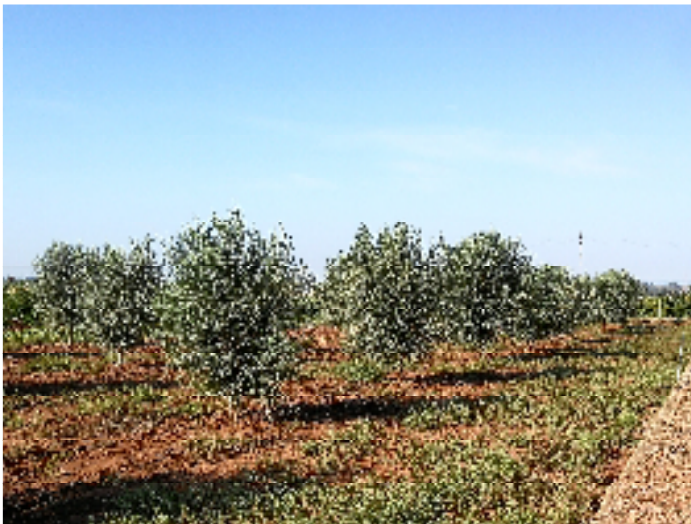
Plantación de 'Farga' de 4 años, marco 7 x 7 m.