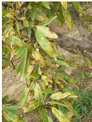
Foto 2. Síntomas de Mancha ocre en hojas de almendro.