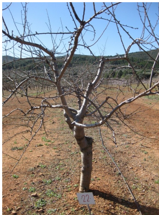
Foto 6. Estado fenológico B (yema hinchada) de 'Mardía' (Altura, 6-3-2012).