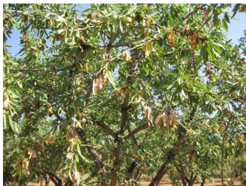
Foto 3. Síntomas de Monilia en hojas de almendro.