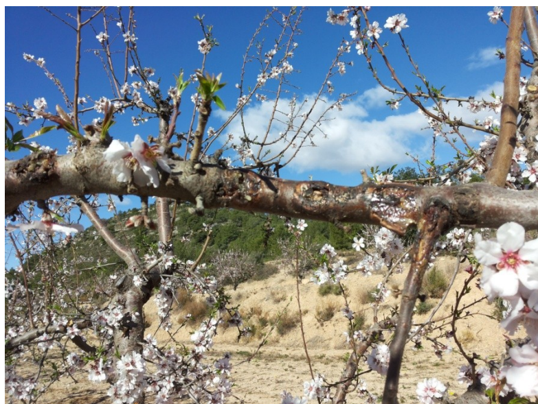
Foto 4. Chancros activos con gomosis en ramas de almendro.

La incidencia de las enfermedades fúngicas anteriormente mencionadas está muy relacionadas con la temperatura y la lluvia en las épocas de floración y brotación; por ello se exponen las temperaturas medias mensuales y las precipitaciones en los meses de febrero a mayo del período 2013-2015, en los que se realizaron las observaciones sobre la susceptibilidad varietal del almendro a estas enfermedades ( Cuadro 1 ).