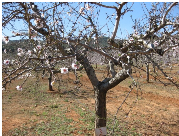
Foto 5. Inicio de la floración (5% F) de 'Guara' (Altura, 6-3-2012).

En la Figura 1 se representa la época media de floración (F) de las variedades de almendro en el período 2011-2015, según el porcentaje de flores abiertas, al inicio de la floración (5% F), en plena floración (50% F) y al final de la floración (95% F). En cuanto a la fecha media de la plena floración (50% F) la variedad más temprana es 'Desmayo Largueta' (4 Febrero) y 'Mardía' es la más tardía (29 de marzo), cuya floración es muy posterior al resto de variedades. La variedad referente 'Guara' tiene la plena floración el 2 de marzo (Foto 5), casi un mes después que 'Desmayo Largueta', pero 27 días antes que 'Mardía' ( Cuadro 2 ); siendo ésta la variedad extra-tardía más aconsejable para las zonas más frías de cultivo del almendro (Foto 6), con riesgo extremo de heladas tardías primaverales (SOCÍAS I COMPANYY et al. , 2010).