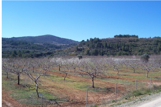
Foto 1. Campo de Experiencias de variedades de almendro en Altura (Castellón)