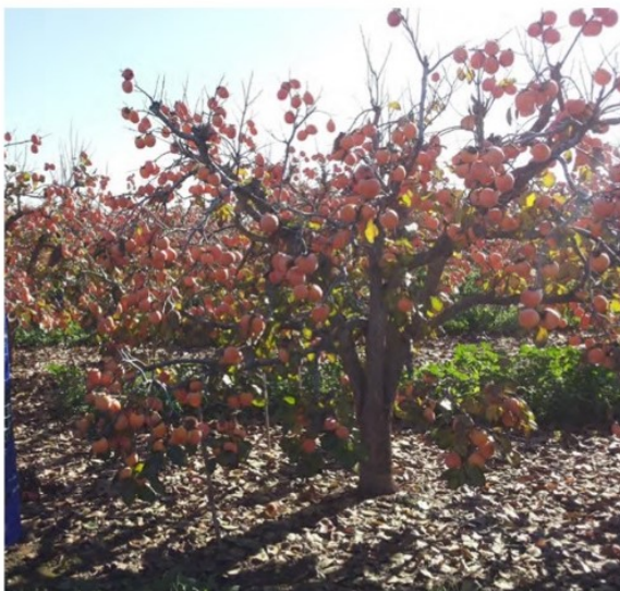
Figura 9. Recolección de frutos de caqui en diciembre tratados con ácido giberélico.

El período de maduración comercial de la variedad `Rojo Brillante` se extiende desde primeros de octubre a mediados de noviembre. La mayoría de la producción se dedica a la exportación por lo que sería muy conviene ampliar el período de recolección. Hasta que no se obtengan variedades comerciales de las características de `Rojo Brillante`, ya en experimentación (IVIA, Dra. Badenes), para adelantar o retrasar la maduración del fruto se realizan tratamientos con productos autorizados. Su eficacia depende mucho del momento de la aplicación, de la dosis y de las condiciones climatológicas. La producción media de una plantación adulta es de 35-45 t/ha.