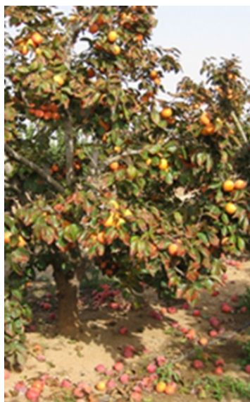
Figura 3 Síntomas de toxicidad por cloruros en caqui ('Rojo Brillante'/Lotus). Hojas con bordes necrosados, maduración anticipada y caída de frutos

El caqui es sensible al estrés hídrico porque reduce el tamaño del fruto. Sin embargo, cuando se aplican mediante RDC restricciones de riego moderadas (< 50%) en junio y julio se reduce la caída fisiológica de frutos y puede ahorrarse hasta el 20% del volumen anual de agua. Las necesidades de una plantación en plena producción son de 4.500-500 m 3 /ha; en árboles jóvenes productivos de unos 3.000 m 3 /ha.