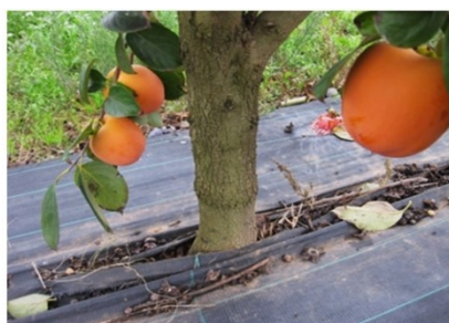
Figura 5. Detalle del cuello liso de Lotus,

Diospyros lotus ( Lotus ). Es el más utilizado por su afinidad con las variedades astringentes (como las autóctonas valencianas), tolerancia a la caliza, homogeneidad del arbolado y precocidad en la entrada en producción. Es muy sensible a la salinidad (especialmente a los cloruros) y al tumor del cuello ( Agrobacterium tumefaciens ). Produce incompatibilidad traslocada con algunas variedades no astringentes ( Fuyu ), incluso reinjertadas sobre Rojo Brillante .