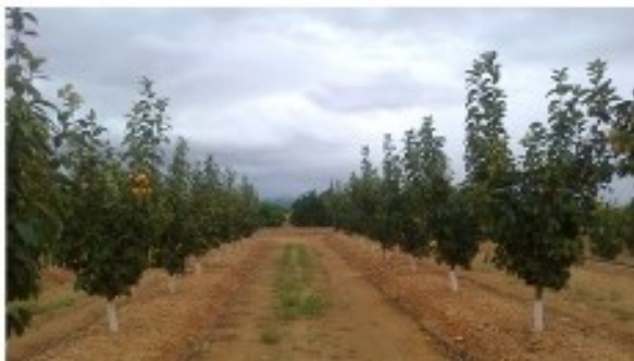
Figura 8. Plantación de caqui en Llíria (Camp de Túria)

En zonas con inviernos más fríos y prolongados no debe plantarse en otoño para evitar heladas, sobre todo si se utiliza el patrón Lotus que es más sensible al frío, es preferible plantar a la salida del invierno. El marco de plantación usual es de 5x3 m (666 árboles/ha), aunque a veces estas distancias se reducen en 0.5 m para intensificar la plantación. No es conveniente estrechar más el marco, en plantaciones a doble cordón (2 filas separadas 1.5m y 4.5m de calle) porque disminuye la circulación del aire en la parcela y se incrementa la incidencia de plagas y enfermedades. También se reduce la efectividad de los tratamientos fitosanitarios al entrecruzarse las copas.