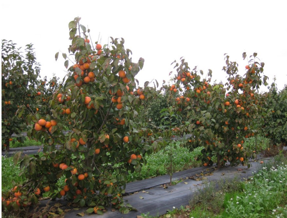
Figura 10. . Campo de caqui en producción ecológica en Carlet (Ribera Alta).

La única dificultad es el control de Cotonets y Moscas blancas, aunque en estas parcelas su incidencia es mucho menor que en las del cultivo convencional. En el control de la Mancha foliar no debe usarse el cobre porque produce fitotoxicidad. Se ha constatado que cuando se usa un fertilizante de extracto de aceite de tomillo tiene un efecto secundario en el control de esta enfermedad. Para más información puede consultar la guía de agricultura ecológica de caqui . Otra información de interés: ; datos producción ecológica del Ministerio . Y en la Comunidad Valenciana I Plan de Producción Ecológica y procedimiento para ayuda a la certificación ecológica en la Comunitat Valenciana .