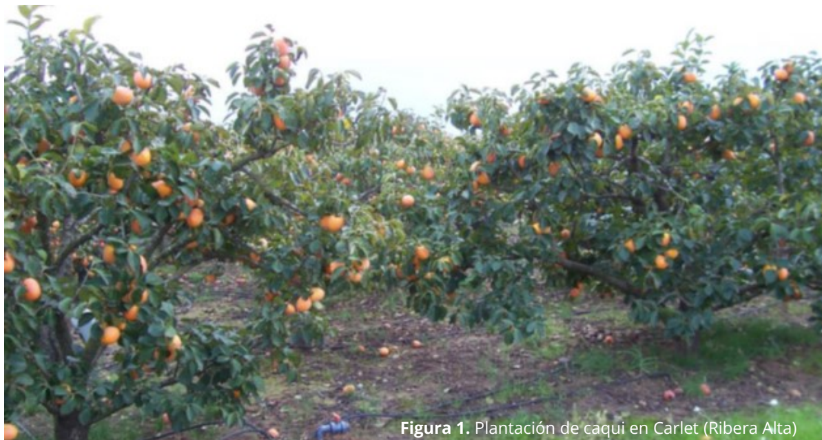
Figura 1. Plantación de caqui en Carlet (Ribera Alta)

El caqui o kaki ( Diospyros kaki ) es un frutal caducifolio de la familia de las Ebenáceas, originario de China, donde se inicio su cultivo, junto a Japón y Corea en el siglo VIII. En el siglo XIX se extendió a Occidente desde EE.UU., y después a Italia, Francia y España. Su fruto es una baya globosa y lobulada (250-300 g), de origen sexual (con semillas) o partenocárpico (sin semillas), de color amarillo-anaranjado que vira al rojo intenso en la madurez. En algunas variedades el fruto contiene gran cantidad de taninos que le dan un sabor astringente en la recolección e impiden