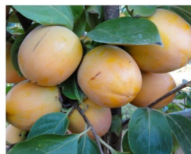
Figura 7 Frutos de caqui Rojo Brillante

VFA o PVA ( Variable a la fecundación astringente ). Los frutos siempre son astringentes, fecundados o no. Si han sido fecundados tienen la pulpa más oscura alrededor de las semillas. Variedades destacables: Rojo Brillante y Triumph (comercializada como Sharon en Israel tras eliminarle la astringencia).