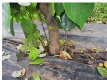
Figura 6. Detalle de sierpes en Virginiana.

Diospyros virginiana ( Virginiana ). Es muy vigoroso. Tolerante a los suelos encharcables, salinos, a los cloruros y al frío. Es tan tolerante a la caliza como Lotus. Produce árboles más heterogéneos y con rebrotes de raíz (sierpes).