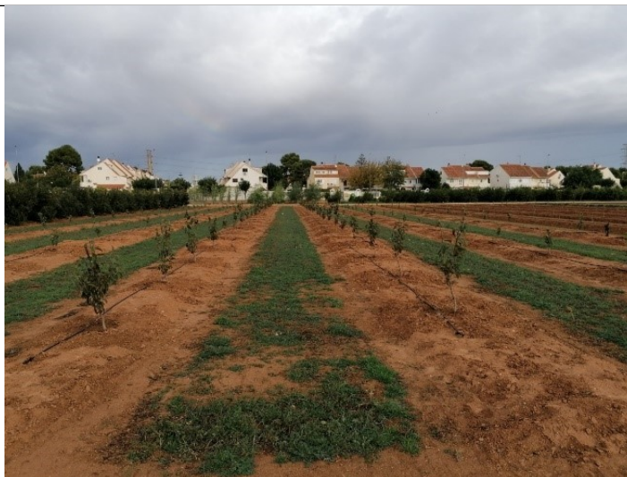
Vista de la parcela experimental Fundación Cajamar en Paiporta