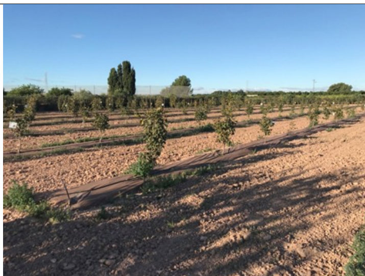
Vista parcela experimental en la Fundación ANECOOP