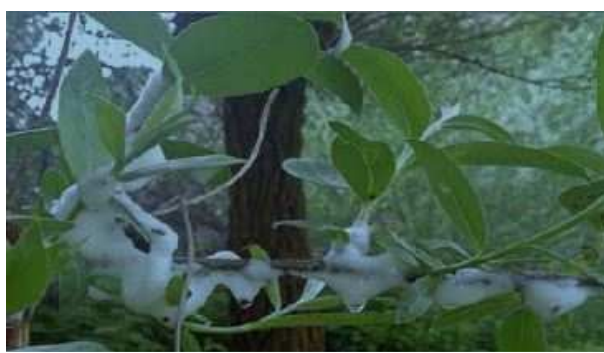
Excrecions de les nimfes de tipus espumós sobre diferents rametes