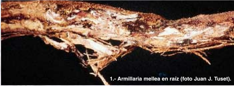
1.- Armillaria mellea en raíz.