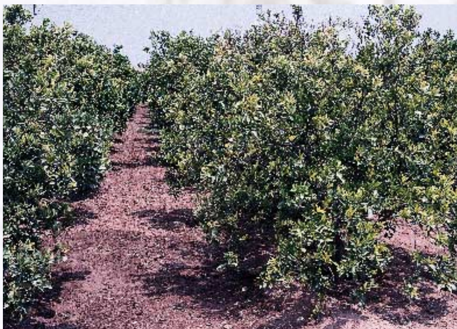
Aspecto de árboles de Navelate/Cleopatra con raíces afectadas por Phytophthora.