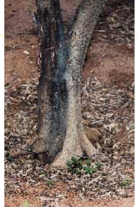
Árbol tratado con oxiclóruo de cobre en zona de patrón pero sigue afectada la variedad.