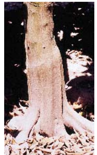
Tronco de árbol sano.