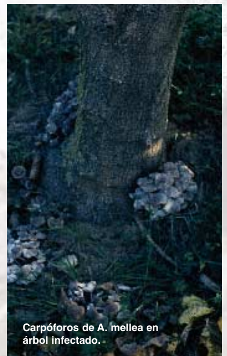
Carpóforos de A. mellea en árbol infectado.

Las zonas afectadas adquieren diversas formas y el tamaño de la lesión dependerá del tiempo que lleve actuando el hongo y de las condiciones ambientales. Normalmente las lesiones son alargadas y si hay suficiente humedad ambiental se producen emisiones de gotitas de goma, cosa que en nuestros campos no suele darse. Las zonas afectadas se deshidratan y se va separando la corteza pudiendo desprenderse en tiras verticales si estiramos desde la zona donde se inicia la separación. Debajo de esta zona la madera puede estar ennegrecida, pero no muerta, por lo que podrá seguir subiendo savia bruta, pero no podrá bajar por esa