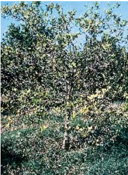
Árbol de Navel / C. Troyer atacado por Armillaria mellea .

SERVICIO DE DESARROLLO TECNOLÓGICO AGRARIO