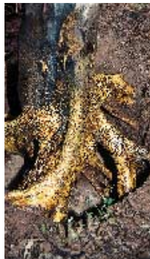
Árbol con Phytophthora recién escarbado.