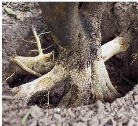
Chancros en base del tronco y raíz por Phytophthora .

cual es la causa del problema, antes de empezar a usar fungicidas en la creencia de que los daños están producidos por hongos.