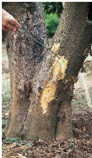
Tronco atacado por Phytophthora con parte saneada hasta llegar a zona no afectada.