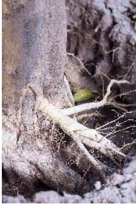
Chancro por Phytophthora en raíz principal.

Se concluye recordando la idea, ya expresada en párrafos anteriores, de que cualquier patrón, en condiciones favorables para el hongo, terminará comportándose como sensible. De aquí que se deban tener presentes una serie de normas que empiezan en el momento de arreglar el plantón, antes de plantar, y que continúan a lo largo de la vida productiva de la plantación. Normas que habrá que adaptar a las exigencias del patrón elegido.