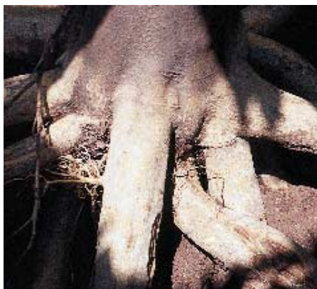
Chancro en raíz principal por Phytophthora .