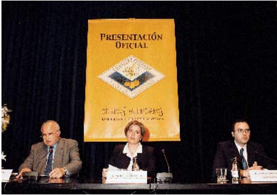
La consellera Ramón-Llin, con el presidente Blasco y el gerente de la IGP en la presentación oficial.

mitiera distinguirlos de los de otras procedencias. El sector estaba buscando desde hace tiempo una plataforma que permitiera promocionar los cítricos en los mercados mundiales.