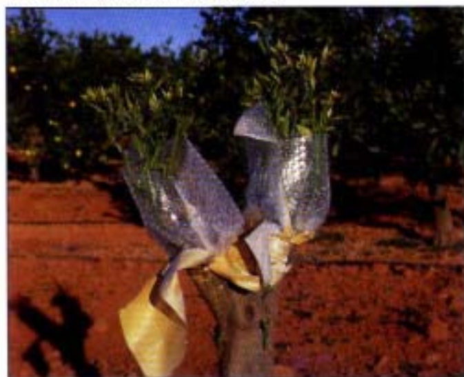
5-6. Injerto de corona de ramas principales.

A continuación se hizo una incisión longitudinal en el patrón para poder separar la corteza de uno de los lados o alas, por ejemplo el lado izquierdo, en este caso el corte dorsal/lateral en la púa también se hizo en el lado izquierdo en la posición de colocado. Se pusieron las púas debajo de la parte de la corteza levantada sirviendo de guía para introducir de arriba a abajo la parte de corteza no levantada (derecha) y se ató con cinta de plástico capaz de proporcionar una fuerte atadura y un buen contacto entre las zonas cambiales del patrón y de la púa. En al-