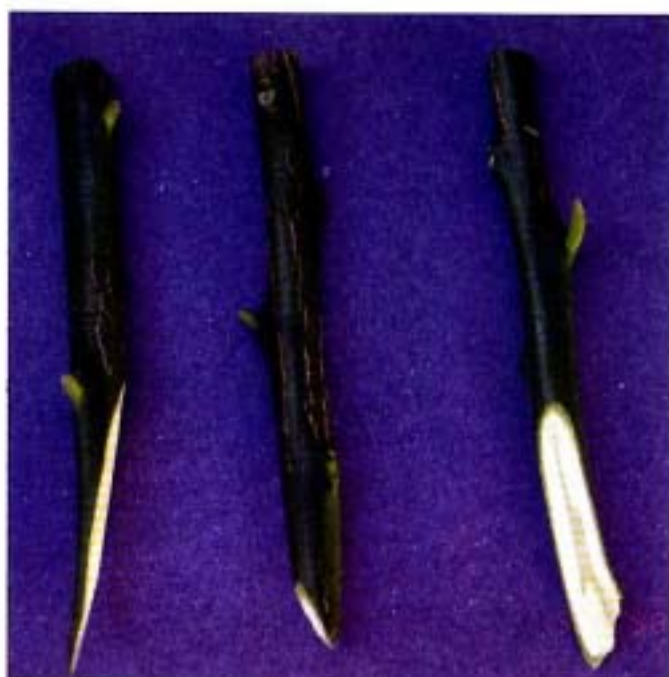
7. Púas para injerto de corona.