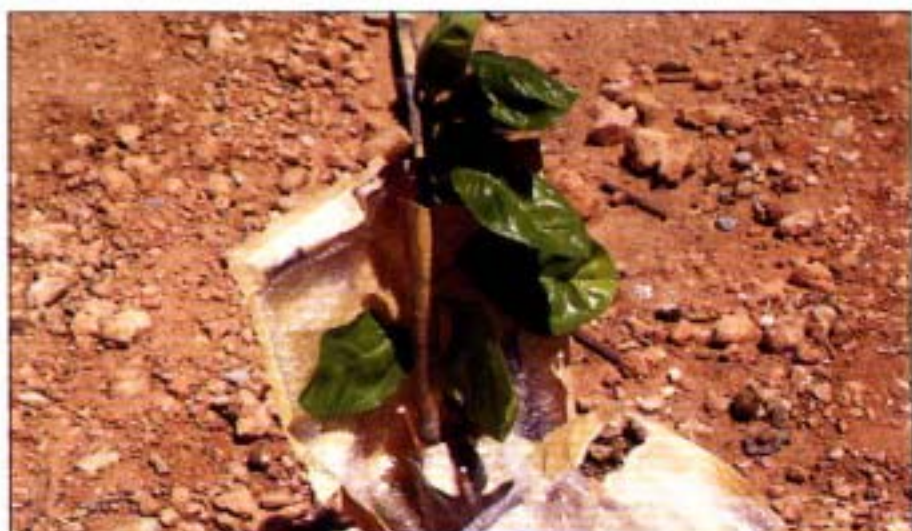
9. Caña tutora y protectora.