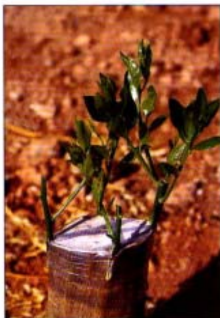
4. Injerto del tronco con 4 púas.