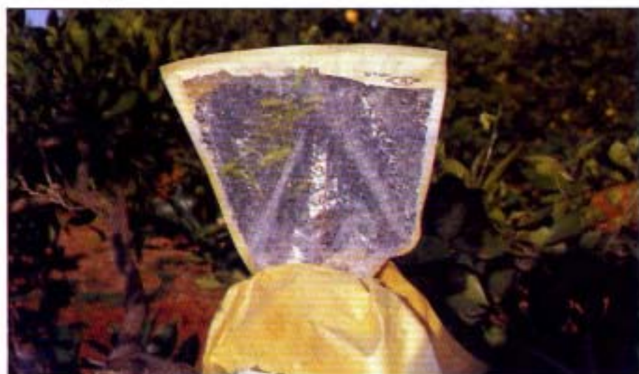
10. Visión del brote a través de la bolsa.