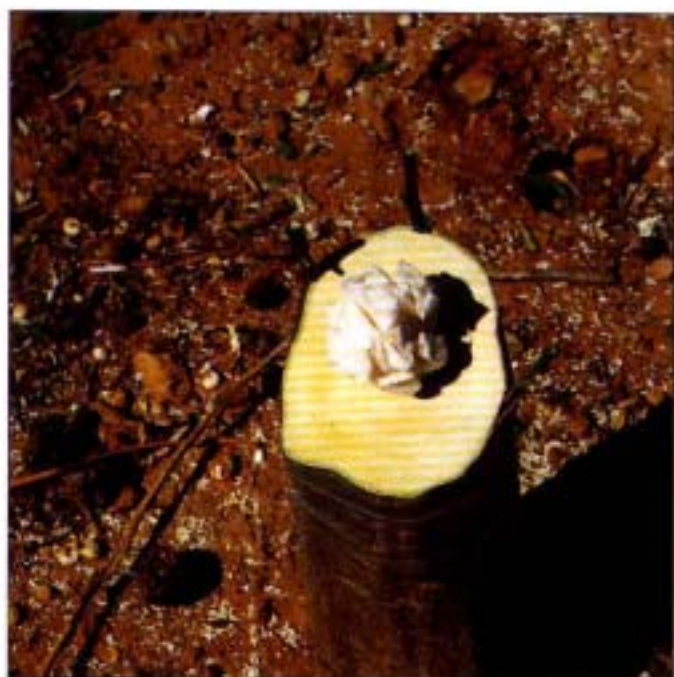
8. Protección de las púas.