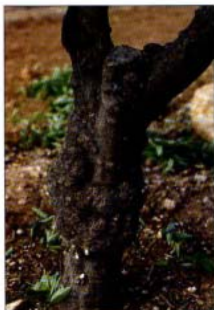
3. Abultamientos en tronco (Arrufalina / Cleopatra).