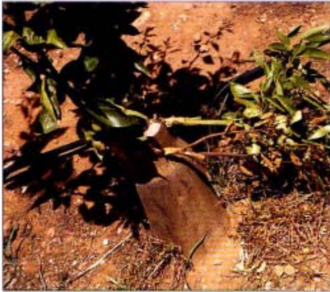
13. Desgajamiento por viento.