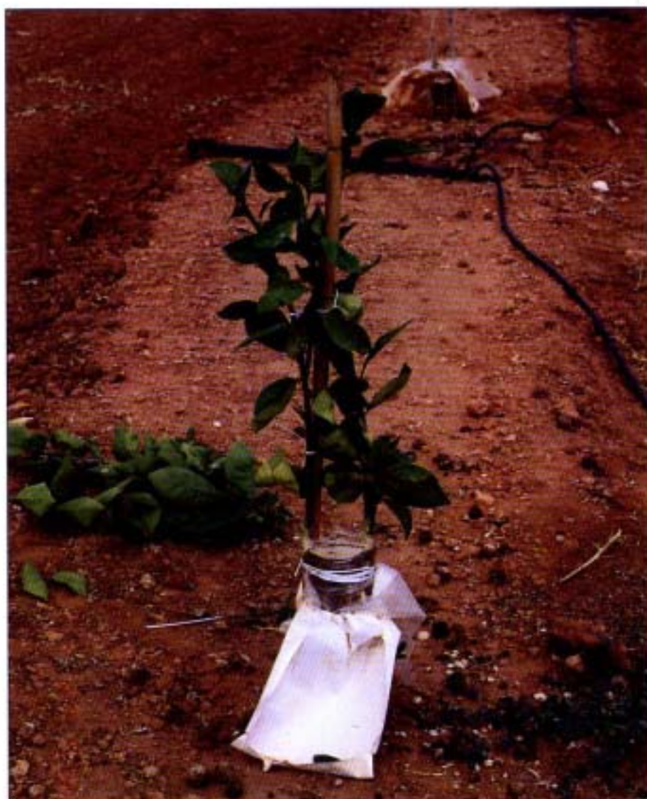
14. Despunte de brotes.