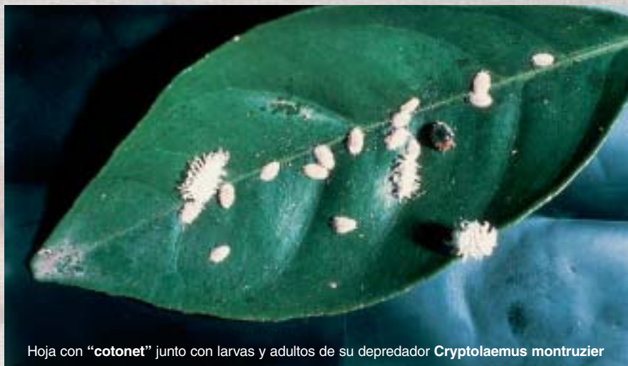
Hoja con “cotonet” junto con larvas y adultos de su depredador Cryptolaemus montrouzier

Por ejemplo en las “normas técnicas” valencianas se recomienda tratar contra piojo gris o serpetas solo cuando se supere un 2% de frutos atacados en cosecha anterior, contra cotonet cuando se supere el 20% de frutos atacados, contra caparreta cuando se