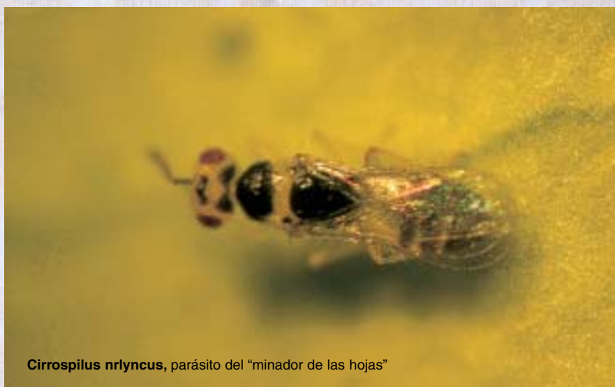
Cirrospilus nrlyncus , parásito del “minador de las hojas”

a) Lucha biológica , tanto por la utilización de entomófagos natural-