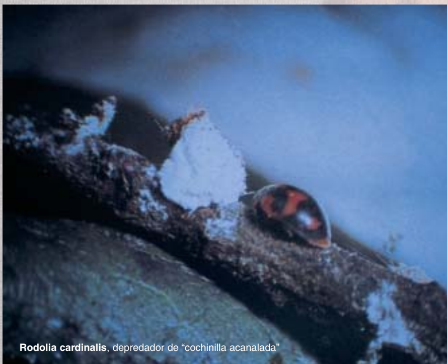
Rodolia cardinalis, depredador de “cochinilla acanalada”

La aplicación práctica de la Protección Integrada se basa en el trípedo siguiente: