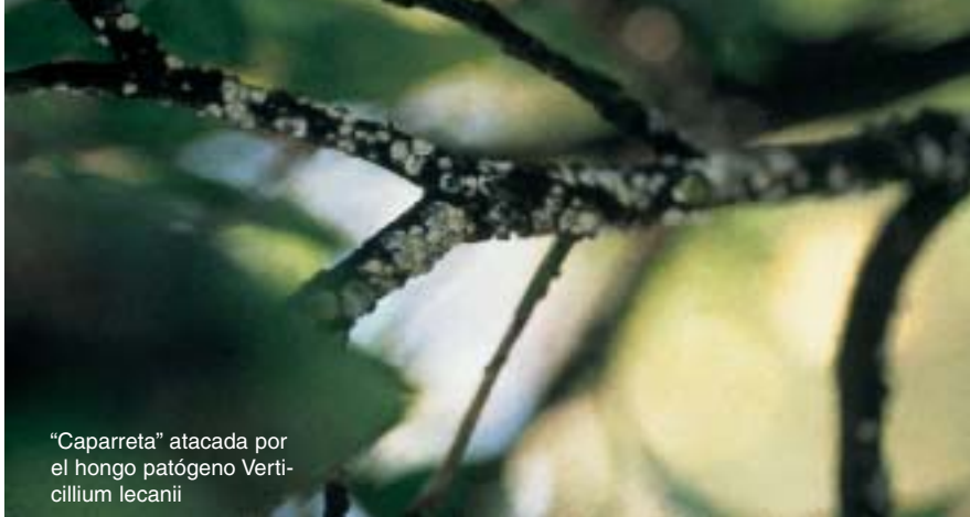
“Caparreta” atacada por el hongo patógeno Verticillium lecanii

mente presentes en el huerto que hay que respetar al máximo, como por la suelta de entomófagos criados en insectario.