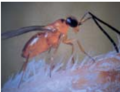
Leptomastix dactylopii, parásito del "cotonet"

Aunque el concepto de "lucha integrada" contra plagas ("integrated pest control") se inició en Europa y Norteamérica a finales de la década de los 50 y fue ya definido por la FAO, a nivel internacional, en 1965, su desarrollo ha sido lento, pero constante y ha adquirido plena vigencia actualmente, como núcleo generador de los sistemas de "Producción Integrada" que tanto interés están despertando estos últimos años y que en el caso concreto de los cítricos ya se han normativizado en cuatro comunidades autónomas españolas (Cataluña, Valencia, Murcia y Andalucía).