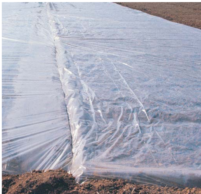
Unión continua a manera de libro