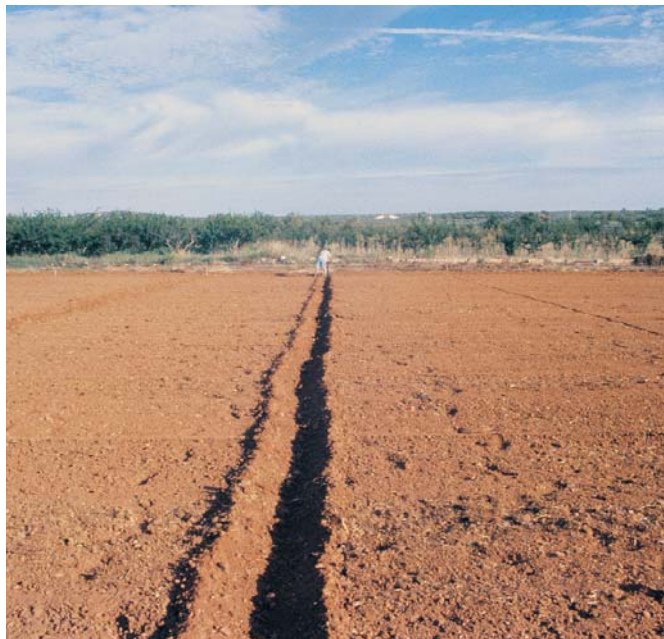
Surco abierto para enterrar los bordes

La mejor época es durante los meses de Julio y Agosto (de primeros de Julio a mediados de Agosto). La Solarización mejorada con estiércol o fumigantes puede ser eficaz desde Mayo hasta Octubre.