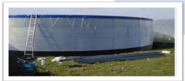
Figura 3 Tanque de agua.

Los tanques de agua pueden estar contruidos de acero con una lámina de plástico en su interior. Los tanques pueden instalarse tanto a nivel del suelo como bajo tierra. Si está bajo tierra, debe considerarse el nivel de la capa freática y, si el tanque es alto en ese caso, debe instalarse un sistema de drenaje.