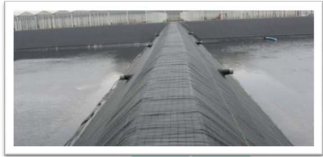
Figura 2 Dique intermedio que separa dos depósitos para evitar la formación de pliegues.

El tamaño habitual de este tipo de almacenamiento suele ser de unos 1.000 m 3 o más. En el caso de un almacenamiento de agua muy grande, suele disponerse de un dique intermedio para evitar que el revestimiento o la lámina se deforme excesivamente.