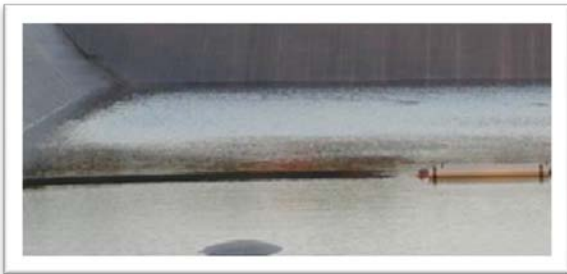
Figura 1 Las burbujas indican la presencia de agua o aire debajo de la lámina (o revestimiento). Si se forman burbujas más grandes, esto puede llevar a la ruptura de la lámina. El agua debajo de la lámina también puede dañar los diques.