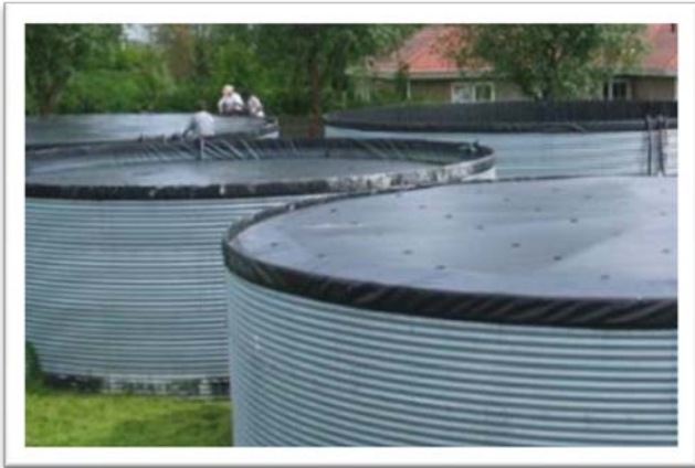
Figura 5 Cubierta de plástico fija estirada sobre un tanque de agua.

En algunos casos se utilizan cubiertas de acero, aunque el precio de estas cubiertas es mucho más alto en comparación con las cubiertas de plástico.