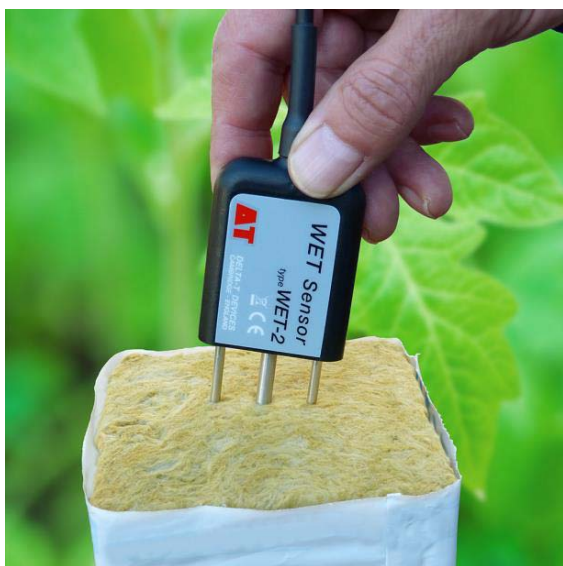
Sensor por reflectometría utilizado para tomar medidas en lana de roca al aire libre ( https://www.delta-t.co.uk ).

Ayuda a estimar la dinámica de absorción de fertilizantes por las plantas, a controlar el riesgo de acumulación de iones en el sustrato, informaciones importantes para ajustar el manejo del fertirriego en tiempo real, que se basa en variaciones de los niveles de concentración de sales fertilizantes entre las entradas y salidas.