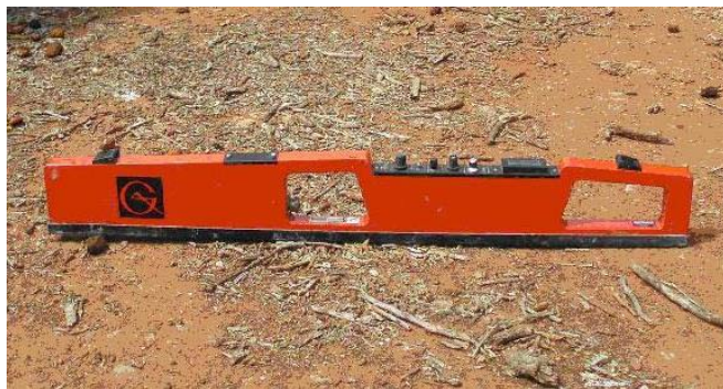
Sensor electromagnético ( http://agrosal.ivia.es/evaluar.html ).