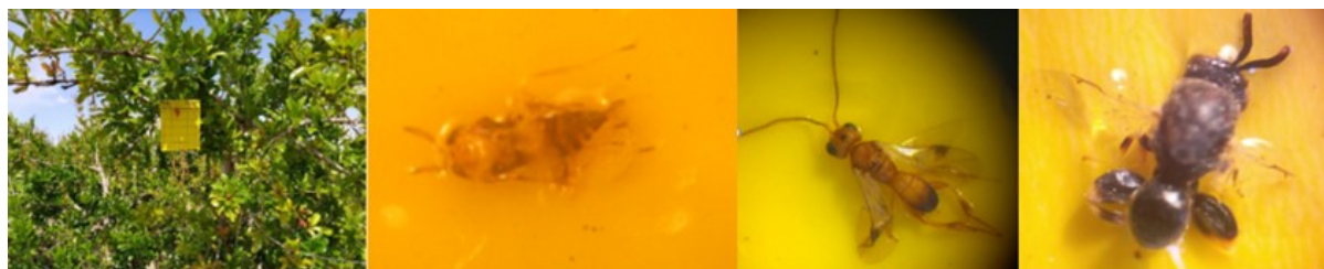
Figura 5: Parasitoides de barrenetas capturados en parcelas de granado. De izquierda a derecha: Trampa pegajosa, Trichogramma sp., Phanerotoma sp. y Brachymeria sp..

Diversos parasitoides de barrenetas han sido capturados en algunas de las parcelas de ensayos en la provincia de Alicante, como Bracon sp., Brachymeria sp., Phanerotoma sp. y Trichogramma sp. (Figura 5). Aunque por sí solos no pueden controlar la plaga, si se utilizan prácticas agrícolas para su protección sí que se podrían reducir sus poblaciones.