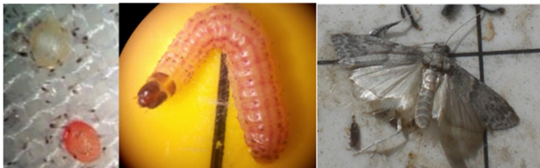
Figura 2. Huevo (izquierda), larva (centro) y adulto (derecha) de Ectomyelois ceratoniae Z.

El adulto de Ectomyelois ceratoniae tiene un tamaño de 2 a 3 cm, con el cuerpo y alas de color plateado. Las orugas son de color rosado y cabeza parda y pueden alcanzar hasta 2 cm en su último estadio de desarrollo (Figura 2). Los huevos, ovalados, recién puestos son de color blanco pero antes de la eclosión adquieren color rosado. La fecundidad por hembra suele ser de unos 150-200 huevos, que coloca preferentemente en la unión de los frutos o en el interior de la corona del fruto. La presencia de otras plagas como cotonet ( Planococcus citri R.) o pulgones, por la melaza o exudados que producen en el fruto, son un estímulo para la puesta. La oruga se protege en un lugar resguardado y se transforma en crisálida en el lugar en el que se está alimentando, estado en el que inverte. E. ceratoniae tiene tres generaciones anuales en las condiciones del sureste peninsular. En la generación del verano y sobre todo en la del otoño ataca a frutos como cítricos, dátiles, almendros, nogales, pistachos, higos y granadas. La presencia de algarrobos cercanos favorece el incremento de sus poblaciones.