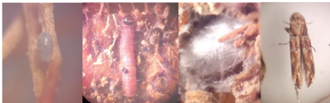
Figura 3. Huevo (izquierda), larva (centro-izda.), pupa (Centro-dcha.) y adulto (derecha) de Antrachyntis badia H.

El adulto de Antrachyntis badia tiene un tamaño de 0,5 cm. La cabeza presenta zonas de color marrón claro anaranjado y zonas blanquecinas. Destacan los ojos que son de color rojo intenso cuando el insecto está vivo. Las antenas son casi tan largas como el cuerpo. La crisálida es marrón con una envoltura o capullo ligero y blanco, y con un tamaño de 0,4cm. Las orugas son de color rosa fuerte y tienen un tamaño de entre 0,6-0,9 cm, con la cabeza marrón y la parte basal negra (Figura 3). Se alimenta de tejidos vegetales muertos o en descomposición, restos de insectos, melaza o negrilla. Puede causar ligeras lesiones en la piel de los frutos, especialmente en fruto de variedades rojas tempranas. En los últimos años, parece que esta especie está desplazando a E. ceratoniae en el granado.