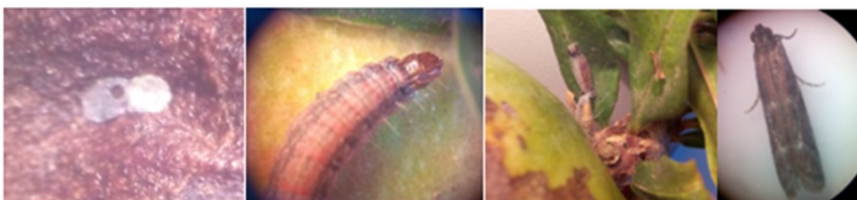
Figura 1: Huevo (izquierda), larva (centro) y adulto (derecha) de Cryptoblabes gnidiella M.