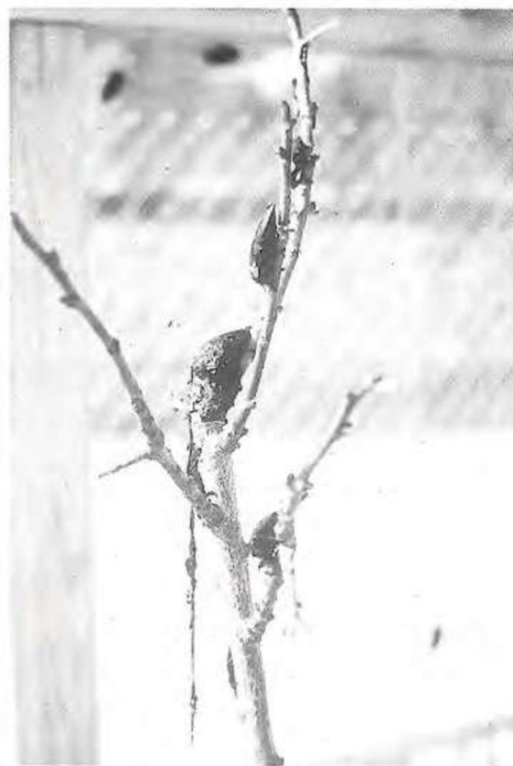
Daños de C. tenebrionis (L.), provocado por adultos en albaricoquero joven.

de polietileno que se cubre de tierra, este sistema no evita que los adultos realicen puesta, pero sí evita que las larvas neonatas penetren en raíces y la parte del tallo enterrada, por no poder atravesar dicha lámina, da buen resultado sobre todo en plantaciones jóvenes, debe permanecer en el terreno durante el período de puesta desde principios de junio a finales de agosto, a partir de esta última fecha se deben quitar las láminas de polietileno, porque con las lluvias y humedad que pueda tener el terreno, podemos causar problemas de tipo patológico a la plantación.