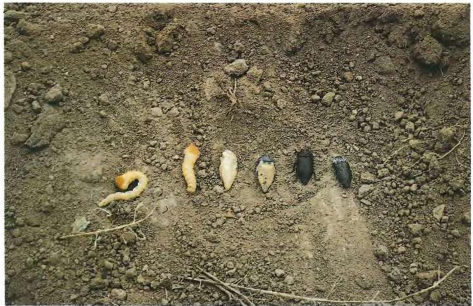
Fases evolutivas de C. tenebrionis (L.), desde larva adulta a imago.

dar la puesta, por lo tanto durante éste último período pueden coexistir hembras viejas y hembras recién emergidas de la nueva generación ovopositando.