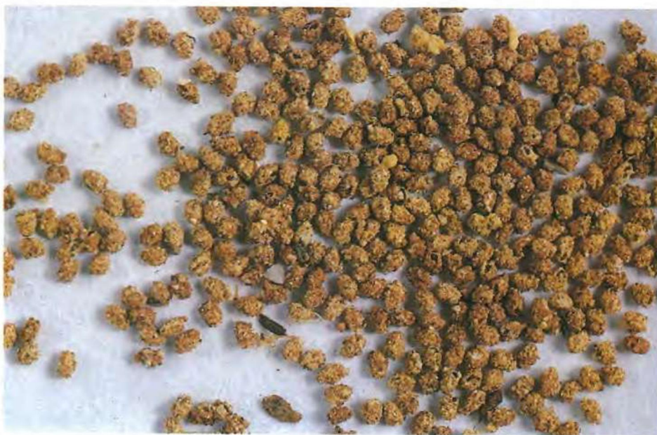
Conjunto de huevos de C. tenebrionis (L.)

Las antenas de las larvas neonatas poseen el primero y el segundo artejo antenal de igual tamaño, en el primer artejo se encuentra un ápice con primordios sensoriales, sensorios membranosos y poros y en el segundo como formación más relevante, pelos setáceos; por contra el primero y segundo artejo de la larva adulta son de desigual tamaño, en el primer artejo no se