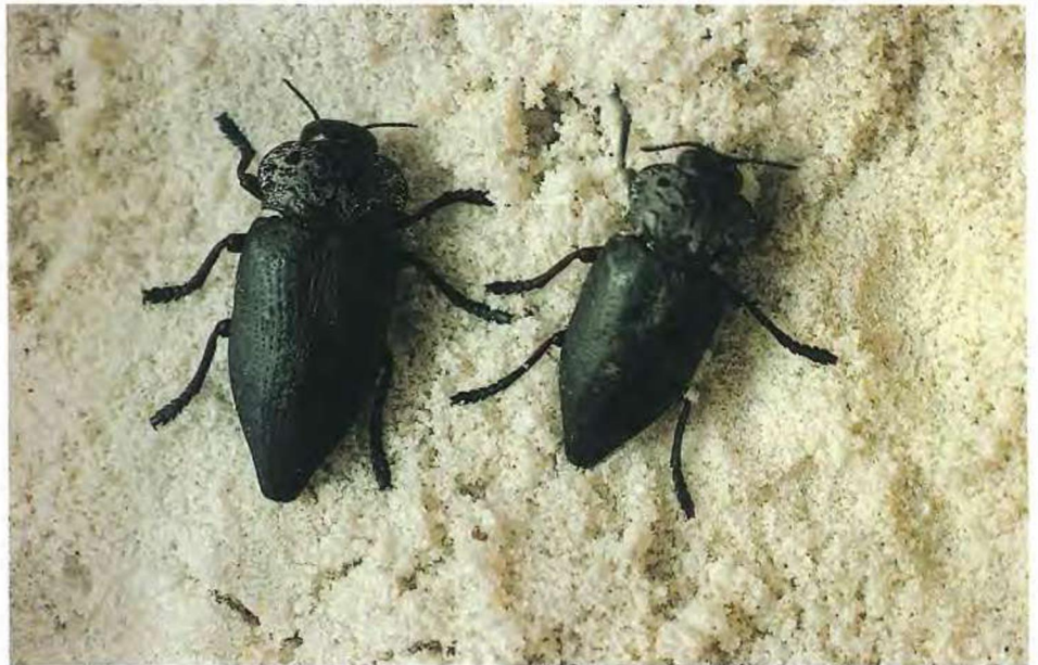
Adultos de C. tenebrionis (L.)

PALABRAS CLAVES: Gusano cabezudo, Capnodis tenebrionis , metiocarb, metilazinfos, metilparation, control del gusano cabezudo.