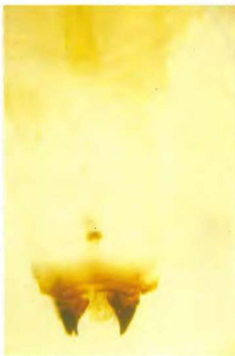
Larva de C. tenebrionis (L.), donde se aprecia el opérculo protorácico.

repiten año tras año dichos índices pluviométricos en los momentos de máxima puesta, sus poblaciones decrece hasta el punto de no comportarse como insecto plaga.