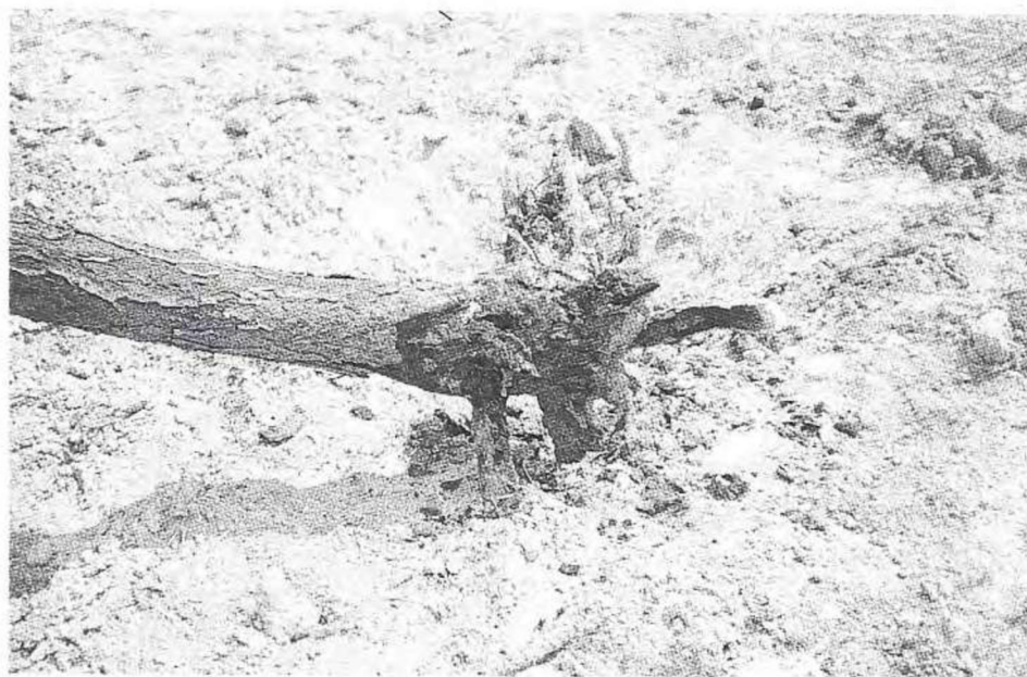
Preninfa y ninfa de C. tenebrionis (L.), sobre tallo de albaricoquero.

Consiste en poner sobre el terreno y alrededor del tronco de los árboles láminas