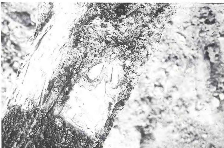
Daños debido a las larvas de C. tenebrionis (L.), en tallo y sistema radicular.

a) Cuando todos los adultos invernantes hayan salido de sus refugios, a partir de mayo y hasta la iniciación de la puesta, tiene