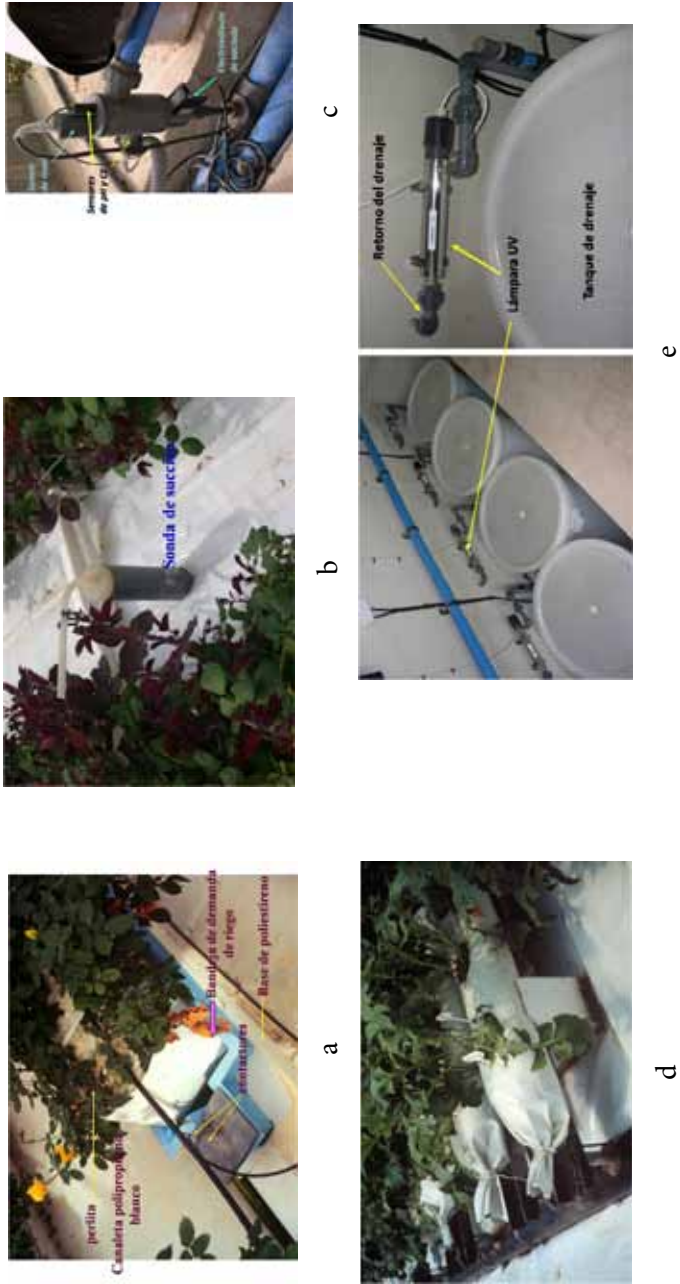
Figura 5. a) Automatización del riego en perlita, b) La sonda de succión. Técnica sencilla de supervisión del manejo del fertirriego, c) Estación de control del drenaje para manejo con recirculación, d) Gerbera en perlita con recirculación de la solución nutritiva, y e) Manejo en recirculación. Tanques de retorno de los drenajes y desinfección UV.