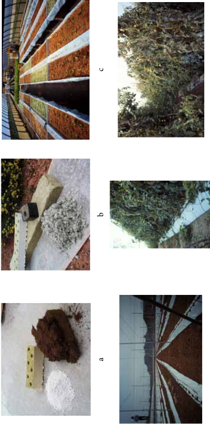
Figura 1. a) Turba rubia, perlita y lana de roca, b) Diversas presentaciones de lana de roca, c) Ensayo de sustratos diversos, d) Preparación de plantación de tomate en arena, e) Cultivo de tomate en arena, y f) Asfixia radicular en tomate cultivado en arena.