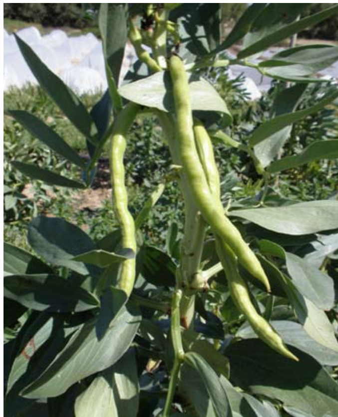
Fructificación del cultivo.