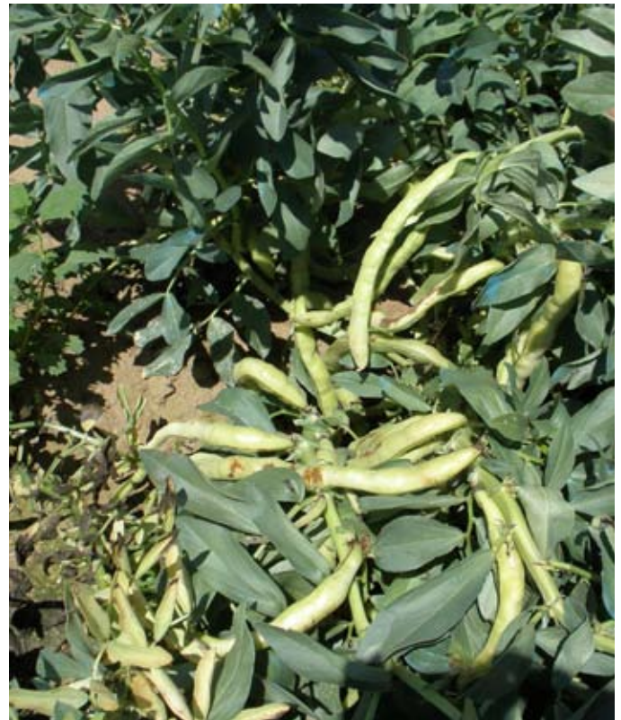
Vainas para semilla listas para recolectar.