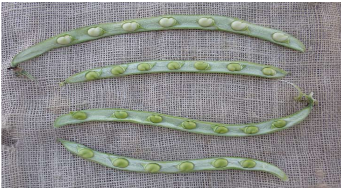
Color grano según su estado de madurez.