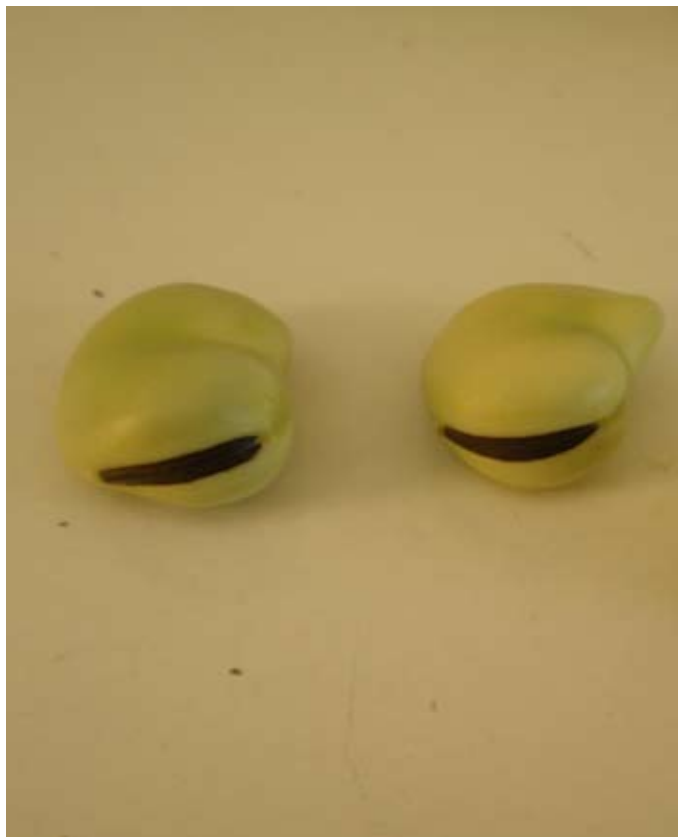
Detalle del hilum ennegrecido en el grano.