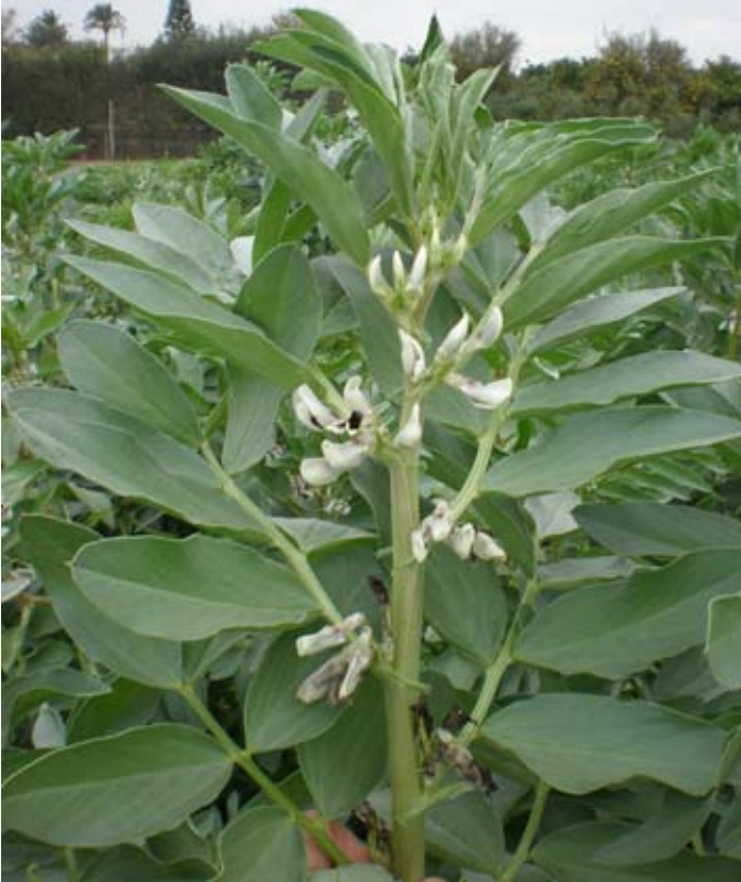
Planta de haba Muchamiel en plena floración.