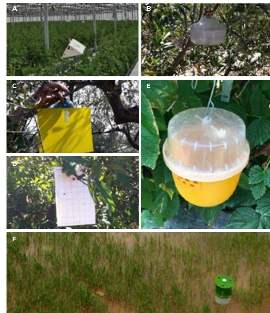
Figura 1. Dispositivos para el seguimiento de poblaciones A. Tuta absoluta B y C. Bactrocera oleae (hembras y machos) D. Aonidiella aurantii E. Chilo suppressalis F. Drosophila suzukii

En resumen, podríamos decir que, utilizando pequeñas cantidades de feromona, podemos interferir específicamente a una plaga de forma sostenible sin provocar alteraciones sobre el medio ambiente ni resultar peligrosos para los aplicadores o los consumidores finales. Actualmente, hay descritos más de 3.500 semioquímicos de insectos, que pueden consultarse en la base de datos The Pherobase: Database of pheromones and semiochemicals. La mayoría de las feromonas que se producen en el mundo se sintetizan químicamente para disponer de cantidades suficientes de producto para actuar sobre las plagas. Sin embargo, algunas de ellas se sintetizan a partir de sustancias de origen natural con rutas biosintéticas similares a las que utilizan los propios insectos para producir las feromonas. Este camino de las rutas biosintéticas está siendo cada vez más estudiado.