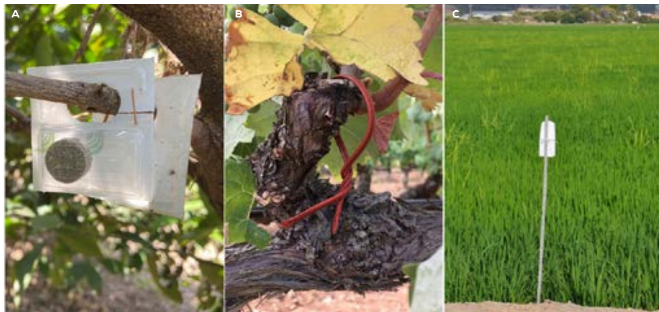
Figura 2. Difusores comerciales de feromona para confusión sexual. Difusores pasivos para A. Aonidiella aurantii y B. Lobesia botrana . Nebulizador para C. Chilo suppressalis (EPA).

La única forma de alcanzar una agricultura sostenible es logrando que los sistemas de producción sean rentables y, en este aspecto, los métodos de control biotecnológicos deben competir económicamente con los métodos de producción convencional.