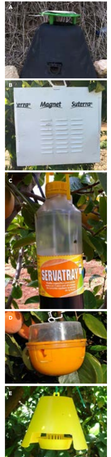
Figura 3. Dispositivos de atracción-afectación. A. Picusan® modificada para atracción infección de Rhynchophorus ferrugineus , dispositivos de atracción y muerte B. Magnet-MED®, C. Servatray®, D. Decis® trap y dispositivo de atracción esterilización para Ceratitidis capitata .

Uno de los pocos problemas que pueden tener estos sistemas de atracción y muerte es la generación de resistencias, ya que se aplican de forma continuada en el tiempo y la exposición puede ser subletal en el caso de contactos leves. Es por ello que es necesaria la alternancia de insecticidas con modos de acción diferentes.