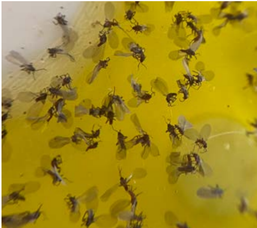
Machos pegados en un dispositivo de atracción y muerte.