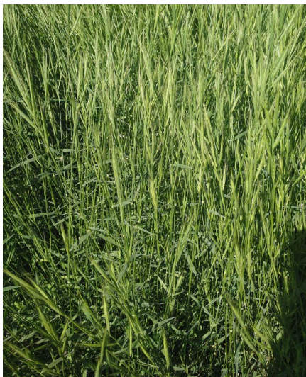
Detalle de cubierta permanente en primavera con predominio de Brachypodium distachyon.

La definición de biodiversidad es la variabilidad entre organismos vivientes de todo tipo u origen, incluyendo, entre otros, ecosistemas terrestres, marinos y otros sistemas acuáticos, así como los complejos sistemas ecológicos de los que forman parte, según el Convenio de Biodiversidad propuesto por el Programa de las Naciones Unidas para el Medio Ambiente (PNUMA, 1992).