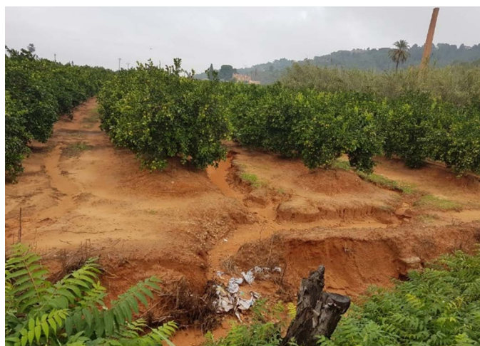
Izquierda, parcela ecológica con cubiertas vegetales en Alzira (València). Derecha, parcela convencional sin cubierta vegetal, colindante con la anterior. Las lluvias de otoño muestran las diferencias entre los fenómenos erosivos de una y otra.

Merece la pena destacar la especial contribución de la biodiversidad a la mitigación y adaptación al problema del cambio climático, y a la reducción de problemas sanitarios gracias al incremento del control biológico natural.