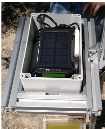
Trampa electrónica para la monitorización de plagas.

— Se consiguió con la tristeza y con la Phytophthora , pero son soluciones a largo plazo. Es un trabajo muy difícil porque estamos hablando de generación de nuevos genotipos. No es como utilizar material genético que ya existe, sino que hay que aplicar técnicas de mejora clásicas o nuevas técnicas genéticas, y todo eso son trabajos que en plantas leñosas llevan bastante tiempo, porque cada ciclo de cultivo es un año; no es como una planta herbácea que puede hacer varios ciclos en un año. Y luego habría que reemplazar todos los árboles en las zonas productoras, que es un trabajo ingente. Aquí en el IVIA ya estamos en eso, pero, de todas formas, creo que hay que mantener la mirada en el horizonte, prepararse para lo que puede venir y no caer en el alarmismo. Asumir la realidad tal cual es y no perder de vista la experiencia de California, que es bastante esperanzadora.