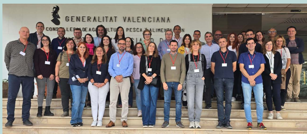
Los participantes en la reunión técnica de la EFSA posan al concluir la jornada.

— Con respecto a las plagas y enfermedades, lo primero es que hay una predominancia sobre todo de artrópodos, eso es lo que más está evaluando la EFSA. En estos momentos, la mayoría de los nuevos brotes que nos estamos encontrando en Europa y que dan más problemas son aquellas plagas que son capaces de infestar especies vegetales muy diversas. Las hay y seguramente aparecerán otras nuevas. Este tipo de plagas son difíciles de combatir porque pueden causar impacto en una amplia gama de huéspedes vegetales. En una plaga que sea muy específica, por ejemplo, una que afecte al manzano, tú vigilas muy bien las manzanas o las plantas de manzano que pueden tener una condición de enfermedad y con eso reduces el riesgo muchísimo. Pero cuando tienes una plaga que puede estar en docenas de especies vegetales, eso dificulta muchísimo más la vigilancia y la prevención de esa plaga.