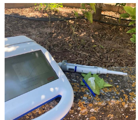
A la derecha, de arriba abajo, daños producidos en naranjas por Phyllosticta citricarpa ; hoja de cítrico afectada por Elsinoe fawcettii , y kit de detección de bacterias asociadas al HLB.